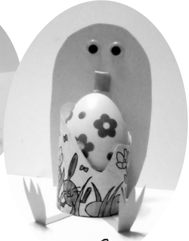
Illustration: © Pfarrbriefservice.de / Sarah Frank